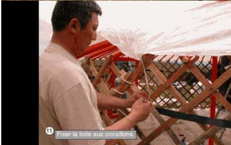
11 Fixer la toile aux croisillons