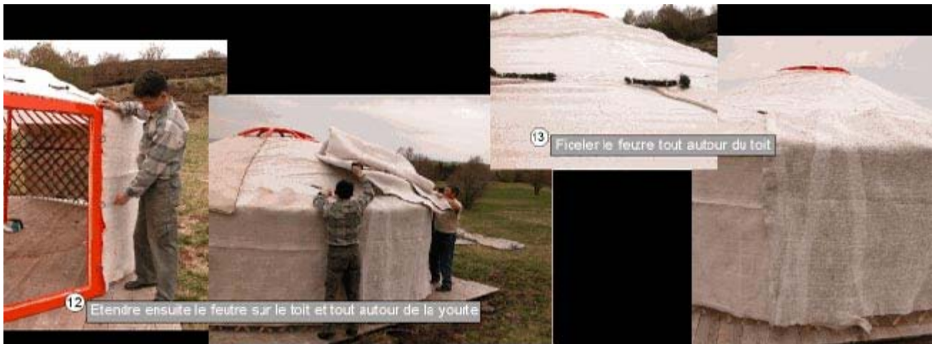
12 Étendre ensuite le feutre s,r le toit et tout autour de la yourte