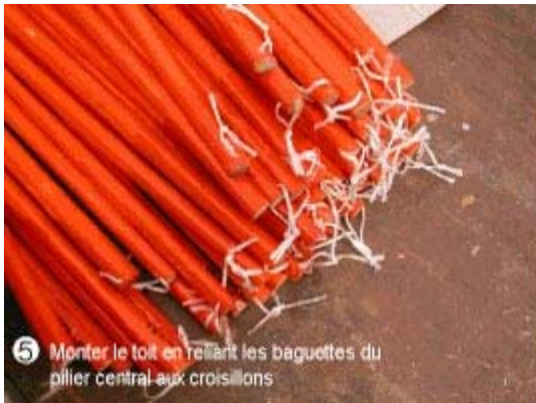
5 Monter le toit en reliant les baguettes du pilier central aux croisillons