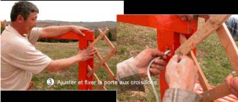
3 Ajuster et fixer la porte aux croisillons