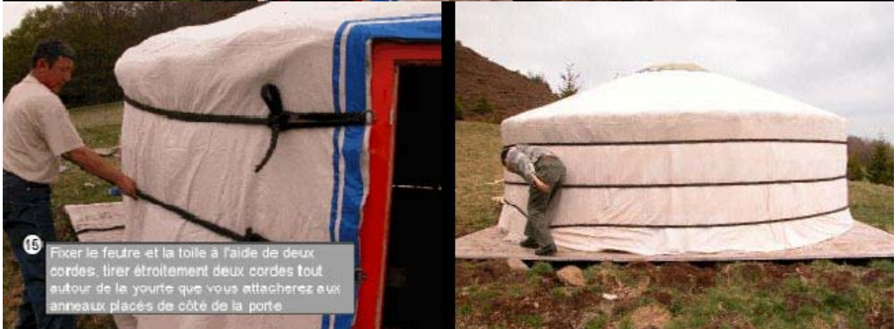
15 Fixer le feutre et la toile à l'aide de deux cordes; tirer étroitement deux cordes tout autour de la yourte que vous attacherez aux anneaux placés de côté de la porte