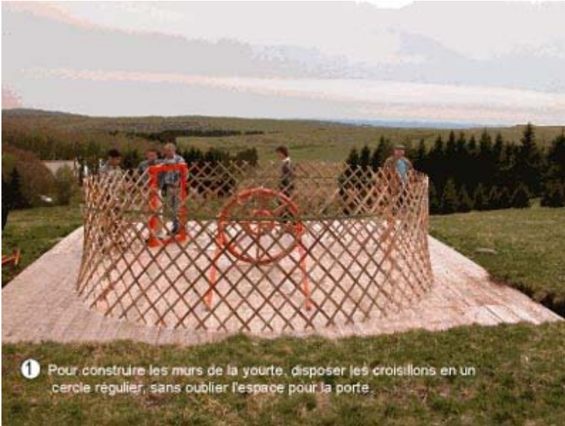
1 Pour construire les murs de la yourte, disposer les croisillons en un cercle régulier, sans oublier l'espace pour la porte.