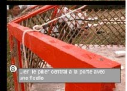
8 Lier le pilier central à la porte avec une ficelle