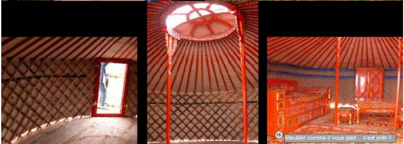
16 Meubler comme il vous plat... c'est prêt !!