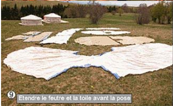
9 Etendre le feutre et la toile avant la pose