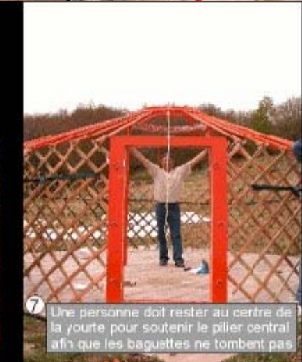
7 Une personne doit rester au centre de la yourte pour soutenir le pilier central afin que les baguettes ne tombent pas