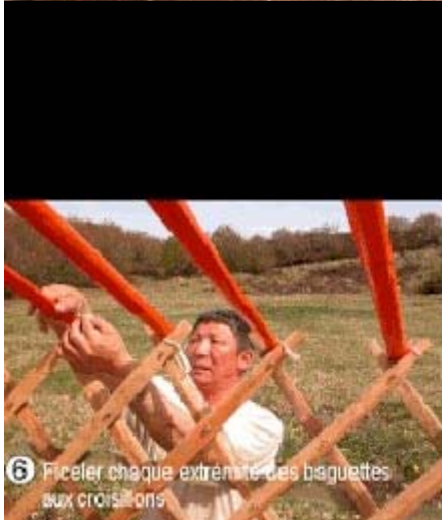
6 Ficeler chaque extrémité des baguettes aux croisillons