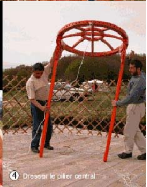
4 Dresser le pilier central